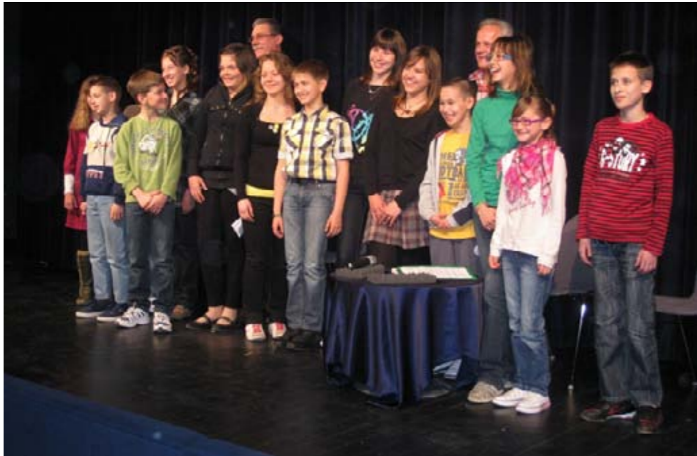
Sudionici dječjeg pričigina, Kazalište lutaka 26. ožujka, 2011.